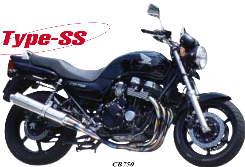
CB750 重量3.85kg・近接排気騒音96db