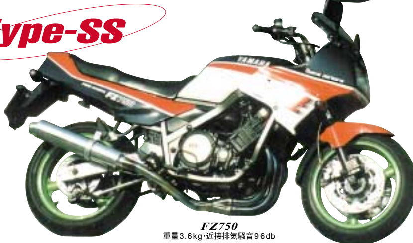
FZ750 重量3.6kg・近接排気騒音96db