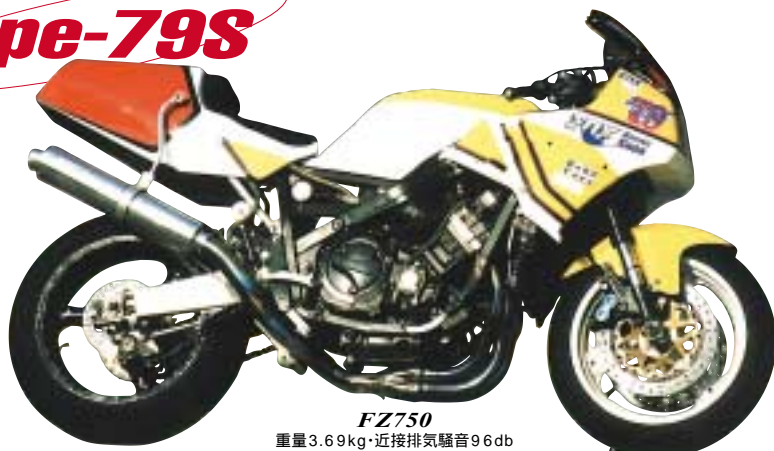
FZ750 重量3.69kg・近接排気騒音96db