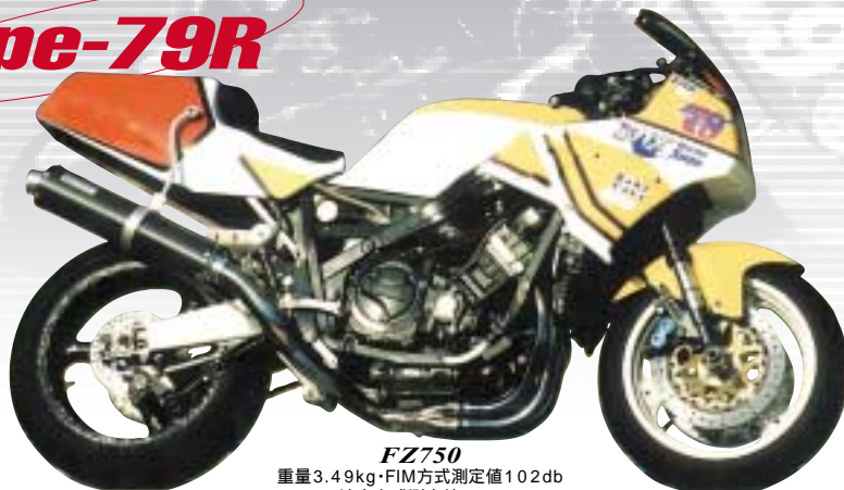
FZ750 重量3.49kg・FIM方式測定値102db (法定方式測定値98db)