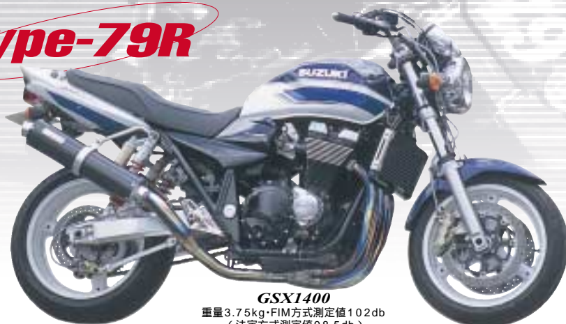
GSX1400 重量3.75kg・FIM方式測定値102db (法定方式測定値98.5db)