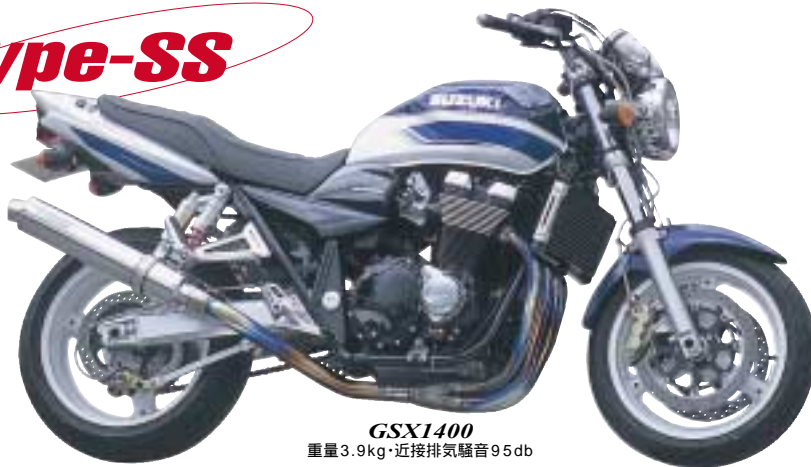
GSX1400 重量3.9kg・近接排気騒音95db