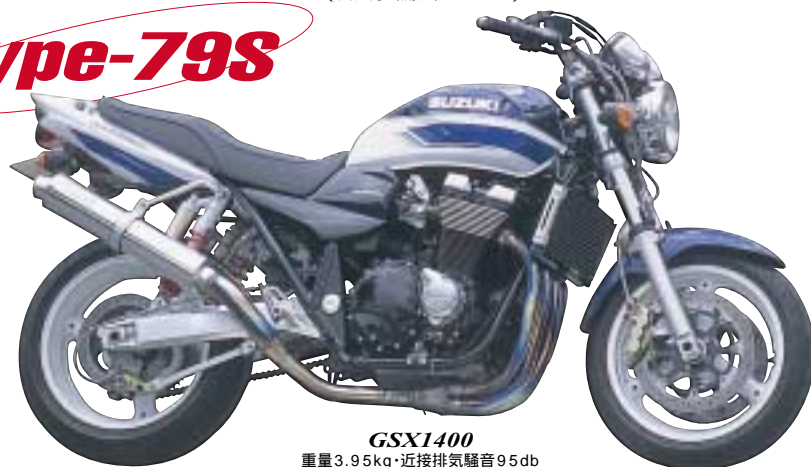
GSX1400 重量3.95kg・近接排気騒音95db