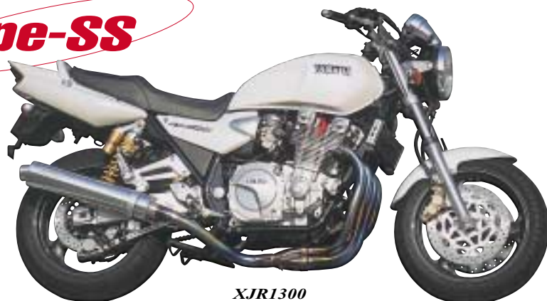
XJR1300 重量3.63kg・近接排気騒音96db