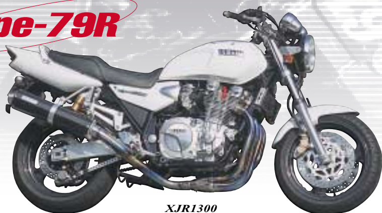
XJR1300 重量3.54kg・FIM方式測定値101db (法定方式測定値98db)