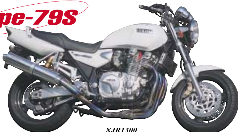
XJR1300 重量3.74kg・近接排気騒音97db